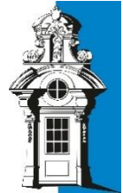
AUGUSTE-VIKTORIA-GYMNASIUM TRIER unesco-projekt-schule